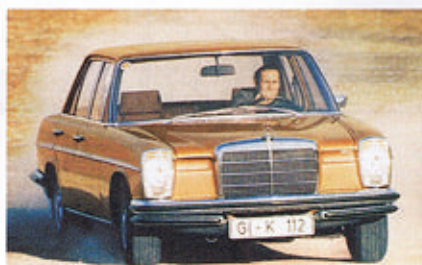
210 AMG-PS in auto motor und sport 4/1973

Wer es gern stärker haben möchte, ist bei der Mercedes-Tuning-Firma AMG richtig. Die aufwendigste Frisur entlockt dem Motor 45 zusätzliche Pferdestärken. Der Testwagen war drei Zentimeter tiefergesetzt, mit härteren Bilstein-Stoßdämpfern und 6 1/2 Zoll breiten Leichtmetallfelgen mit Michelin-Reifen 205/70 VR 14 ausgerüstet. Diese Modifikationen kommen natürlich den Fahreigenschaften zugute, aber eben auf Kosten des Fahrkomforts.